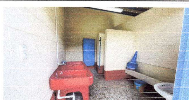
Foto 6: Instalación de tubería para agua potable incluyendo sus accesorios.

Observación: Si es necesario se pueden agregar hojas adicionales y actualizar el número de hojas.