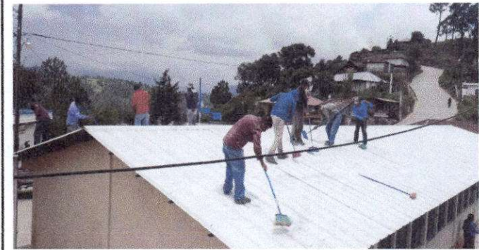
Foto 1: Mantenimiento a estructura metal "lijado y labado de techo"